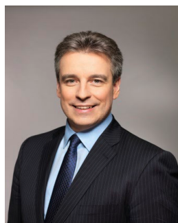
Claude Meisch Ministre de l'Éducation nationale, de l'Enfance et de la Jeunesse

Je tiens à remercier l'Entente des Foyers de Jour a.s.b.l., les nombreux membres bénévoles, ainsi que le personnel qualifié pour leur initiative et leur engagement, d'avoir accepté de traiter le sujet complexe de la sécurité alimentaire et d'avoir développé ce guide aussi pratique qu'utile. Je me réjouis qu'une collaboration fructueuse entre les associations privées et les institutions publiques ait donné lieu à un guide qui apporte une contribution essentielle à l'assurance de la qualité au sein des services d'éducation et d'accueil pour enfants.