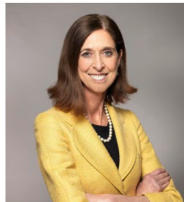
Lydia MUTSCH Ministre de la Santé

Ce guide est un élément clé pour assurer la sécurité alimentaire dans les établissements d'accueil et d'encadrement ceci dans l'intérêt de la santé de nos enfants.